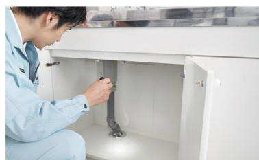
▲ 水回り関係は住宅の中でも最も気をつけたい場所。10年以上経過している場合は一度点検を。

水廻りが心配だ。チェックしたけど良く分からない。水漏れがしてきた！ そんな時は当社にお任せ！